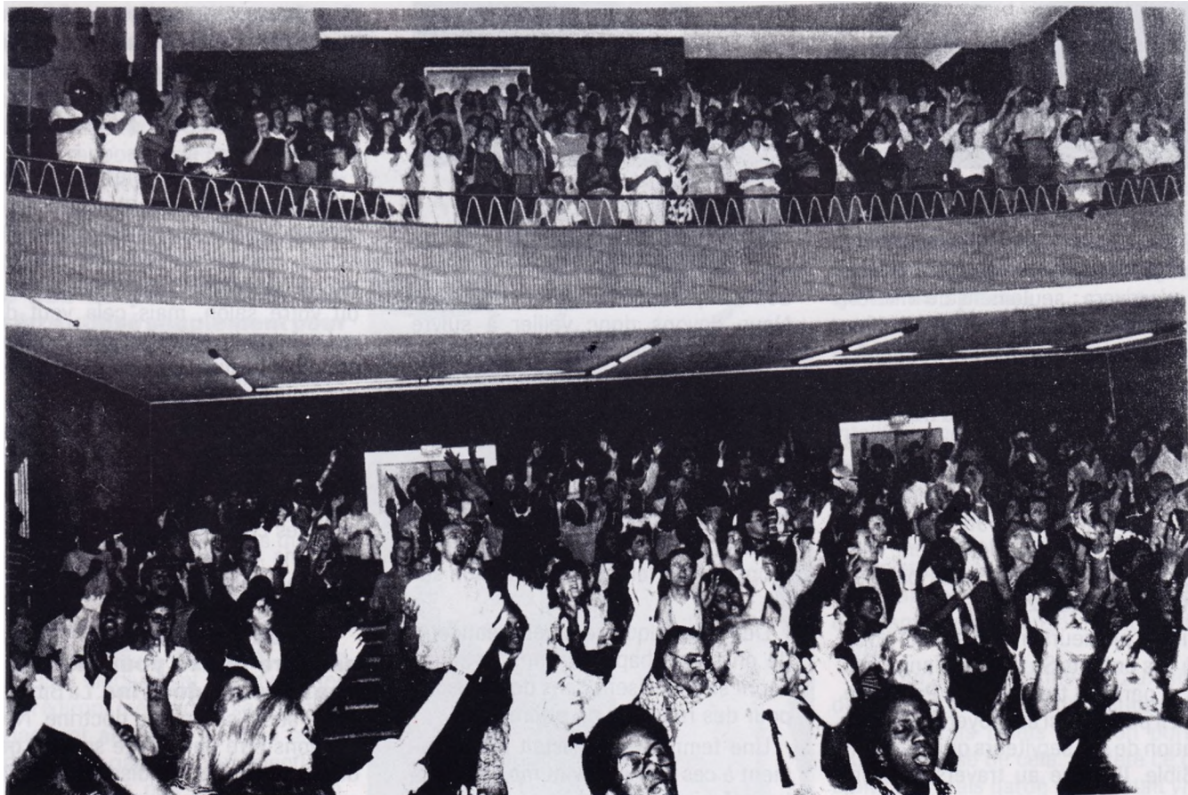
Tous les soirs de la campagne, la grande salle était pleine, et les cœurs débordaient de louanges pour le Seigneur.