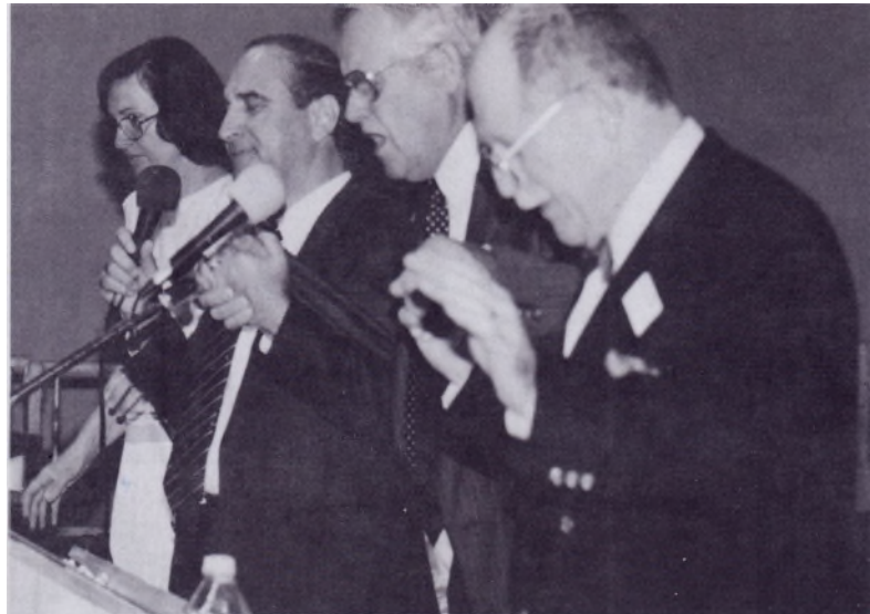
Les moments de prière et de communion fraternelle furent une source de profond renouvellement.