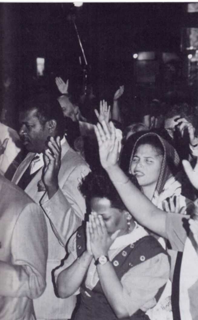
Un esprit de louange et d'adoration débordait des cœurs.

profondément et concrètement touché par le ministère essentiel de l'œuvre Compassion : La Mission . Le champ, ce n'est pas une église, une ville, ou même un pays ; ces entités n'en sont qu'une partie. Jésus Lui-même a dit : «Le champ, c'est le monde» (Matt. 13 : 38). La vision de notre Maître, c'était les multitudes qui se perdent dans le monde entier. Il est venu pour communiquer cette vision ; Il a donné Sa vie pour en payer l'inaccessible prix. La grandeur et la sainteté d'une telle vision lui confèrent à jamais un caractère exceptionnel.