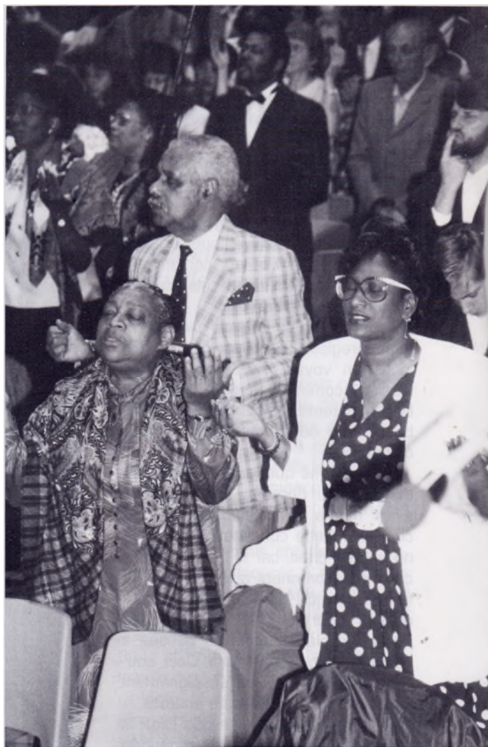
Dieu habite au milieu des louanges de Son peuple.

«Le Seigneur s'est glorieusement manifesté au milieu de nous pendant ce week-end de Pentecôte 91.