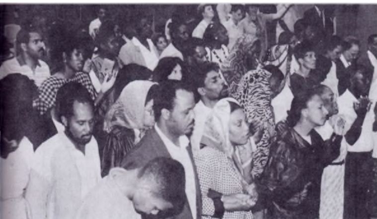
La présence du Seigneur a été puissamment ressentie par chacun.

sieurs jours plus tard. Un grand nombre ont été guéris de divers maux, et sont venus donner leur témoignage, notamment pendant la dernière réunion. D'autres ont été profondément renouvelés, comme Dieu seul peut le faire, et ont ainsi pu retourner chez eux en étant remplis à ras-bord de force, de courage, de joie et de l'amour du Seigneur. Plusieurs également ont répondu à l'appel à la conversion et se sont approchés de Jésus dans des flots de larmes de repentance. De grandes victoires ont ainsi été remportées, des brèches dans le terrain de l'ennemi ont été faites, et le beau nom de Jésus a été pleinement glorifié.