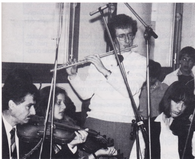
Une partie de l'orchestre de la Convention « Louez le Seigneur avec des instruments à corde, avec les cymbales sonores