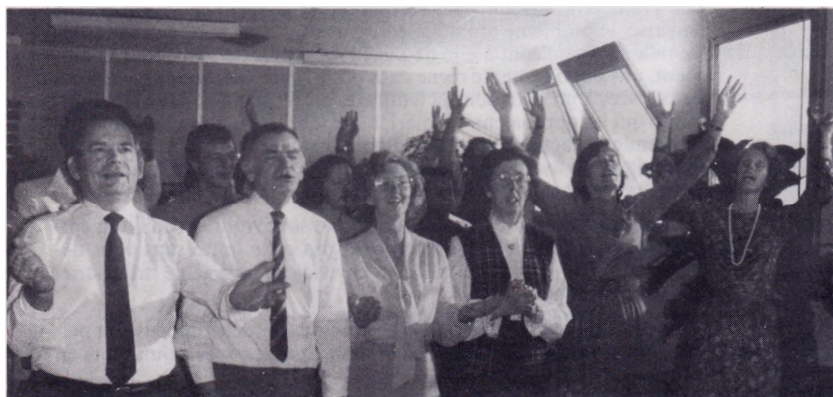
Les moments de louange et d'adoration furent une source de renouvellement pour tous les chrétiens.