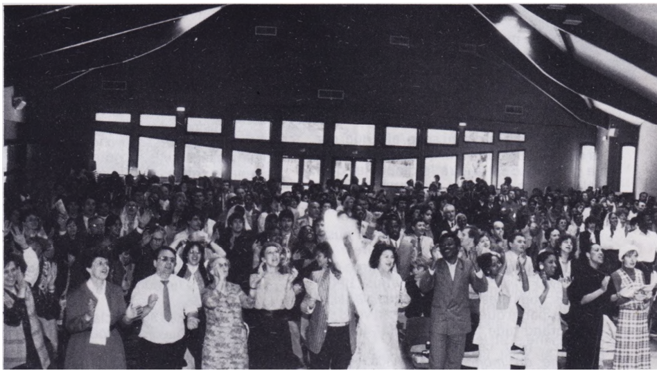
Environ 600 chrétiens venus de différentes régions de France et de Suisse louent le Seigneur de tout leur cœur dans la nouvelle salle de conventions.