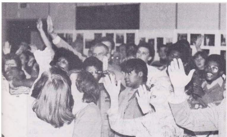
La joie de l'Eternel est notre force !