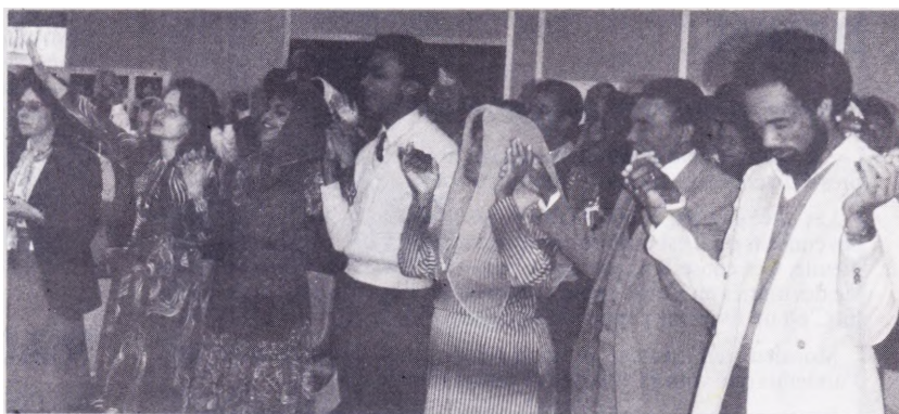
Nous étions réjouis d'avoir au milieu de nous un grand nombre de frères et sœurs martiniquais venus de Paris.