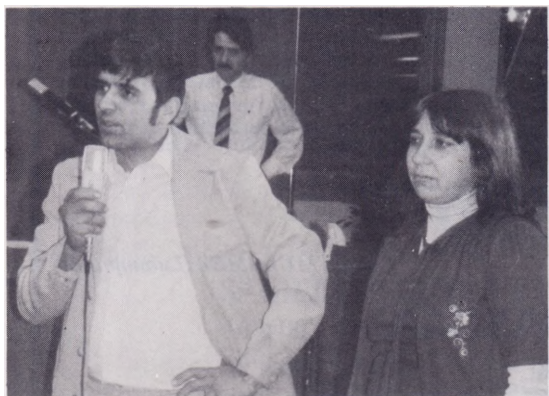
Témoignage de guérison d'une grave infirmité de la colonne vertébrale.