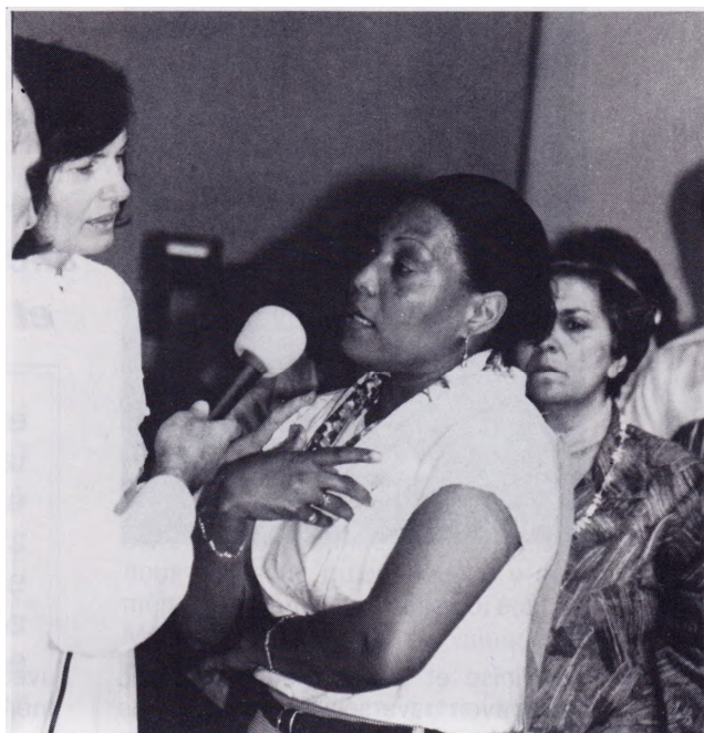
De nombreux malades furent guéris.