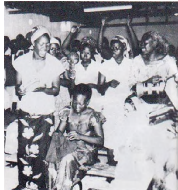
Tout le séminaire se déroule dans un esprit de louanges.