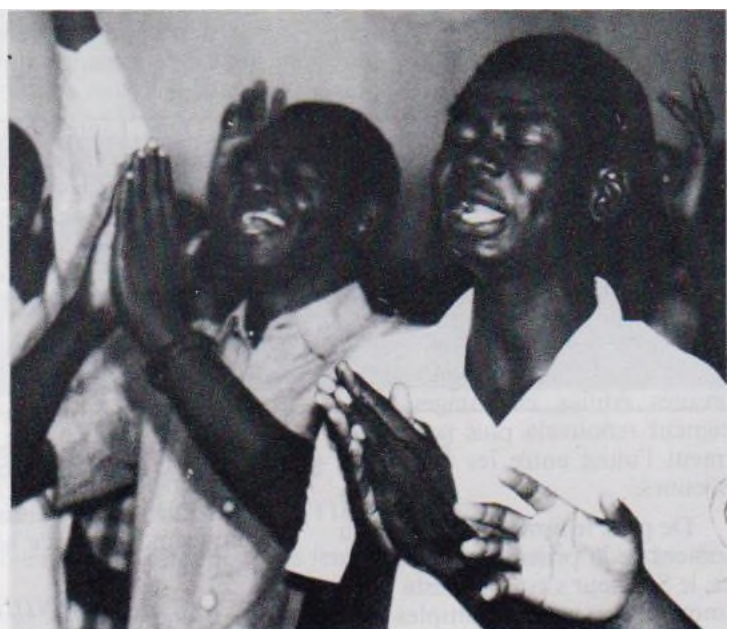
L'adoration. premier ministère du chrétien.