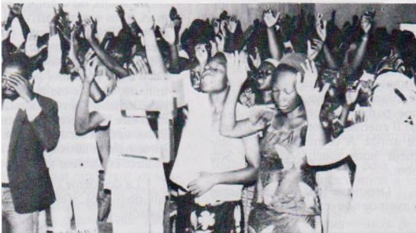
L'esprit d'adoration était répandu sur toute l'assemblée.