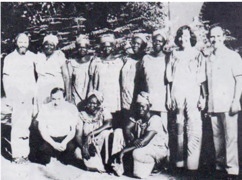
L'équipe Compassion avec le groupe de dames de la «Bonne Nouvelles».

Le Seigneur est merveilleux et plein de compassion. Il a entendu nos voix et a éteint la soif de son peuple. Des frères ont abandonné leurs activités quotidiennes pour venir chercher la face du Seigneur. Nous avons eu des moments de grandes bénédictions ; c'était le «Ciel Ouvert» à Sarh.