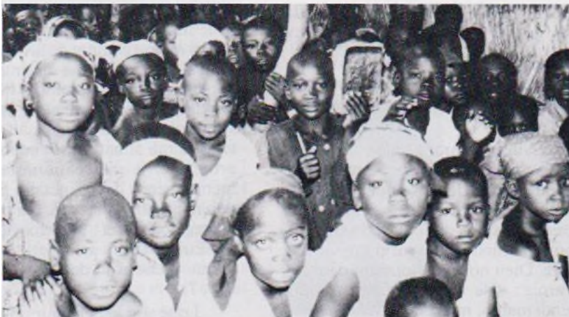
Les enfants aussi ont participé à la bénédiction.