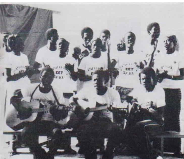
Groupe de jeunes de l'église chantant pendant la réunion d'évangélisation à Sarh.