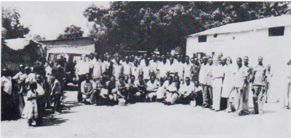
Les serviteurs de Dieu présents au séminaire de Sarh. Tchad.