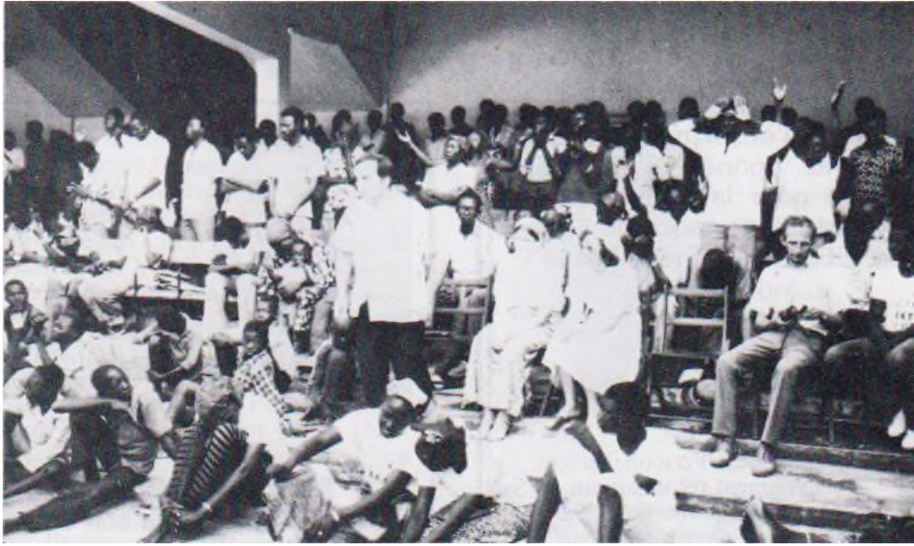
Réunion d'évangélisation dans un cinéma en plein air, à Sarh.