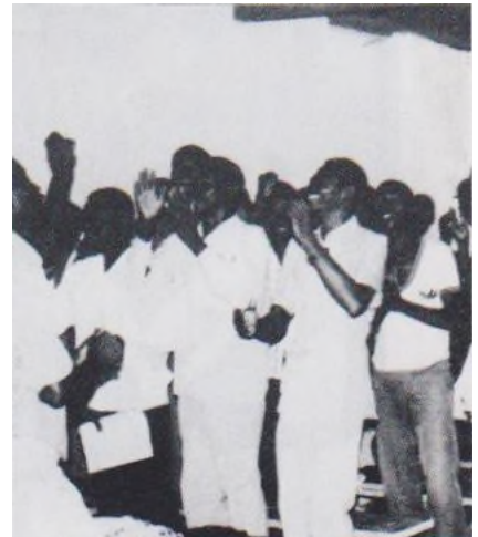
Les cœurs débordent de joie !