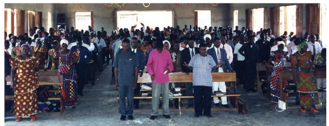
Séminaire pastoral avec la participation de nombreux serviteurs de Dieu et leurs épouses.