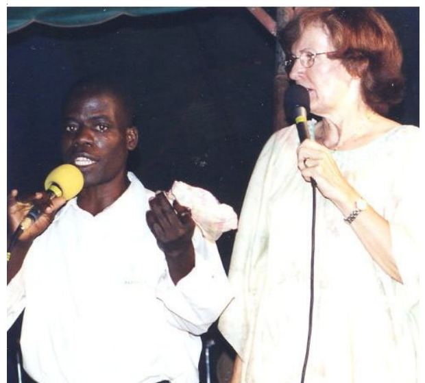
Guérison d'une infection des yeux qui ont instantanément cessé de couler.