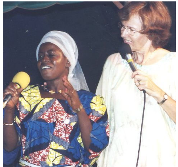
Guérie d'une oreille sourde.