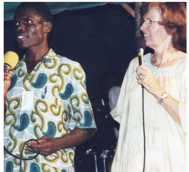
Guéri de graves ulcères d'estomac qui l'empêchaient de se nourrir.