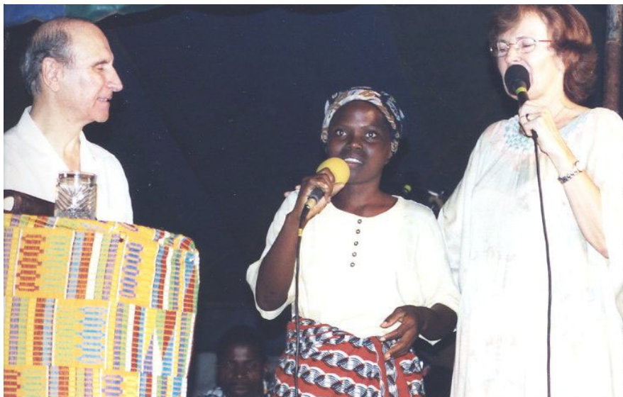
Cette femme paralysée d'une jambe rend témoignage de sa complète guérison.