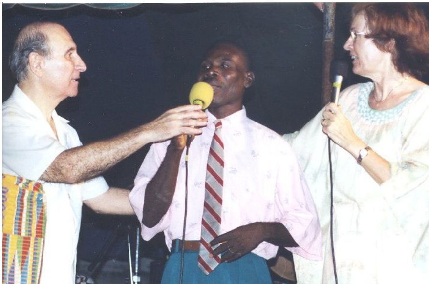
Une hernie disparaît entièrement après la prière.