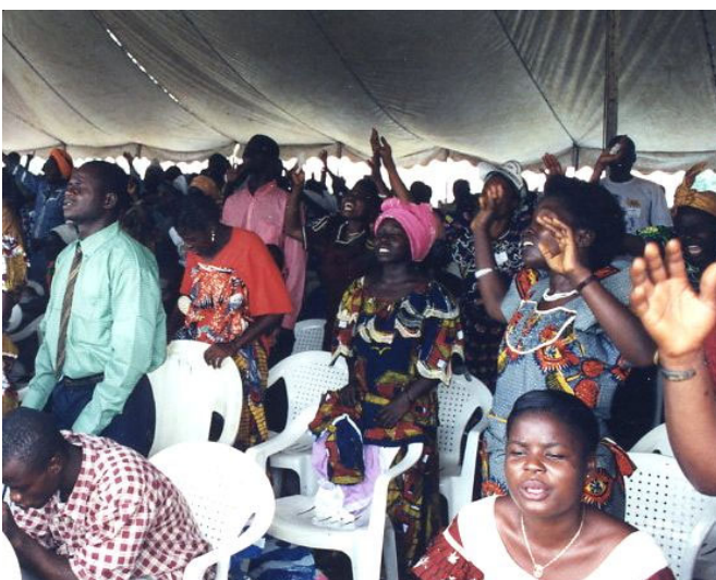
Une toute petite partie du vaste auditoire.