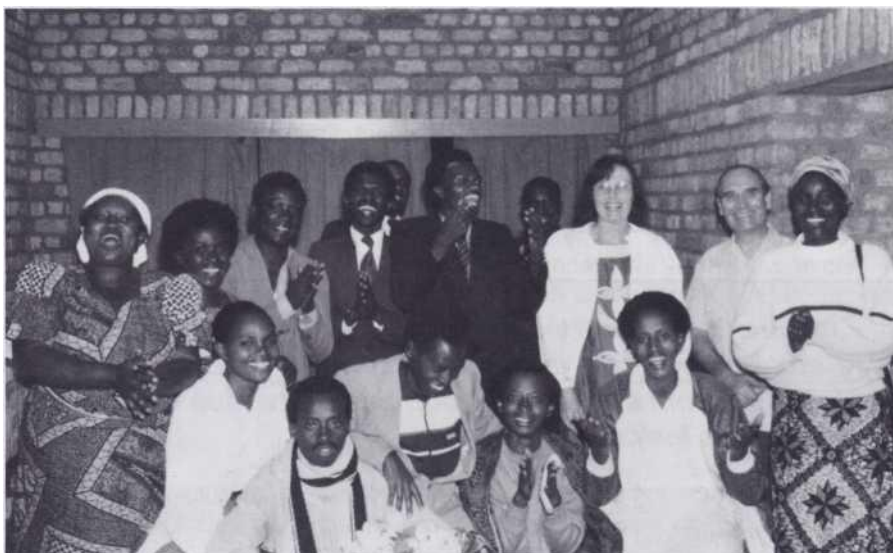
Nos amis de Gitega, qui ont merveilleusement bien organisé toutes les réunions dans cette ville.