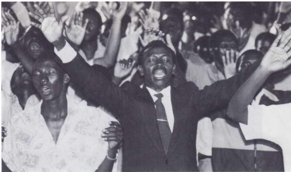
Tout le monde était saisi par la très forte présence de Dieu pendant les réunions.