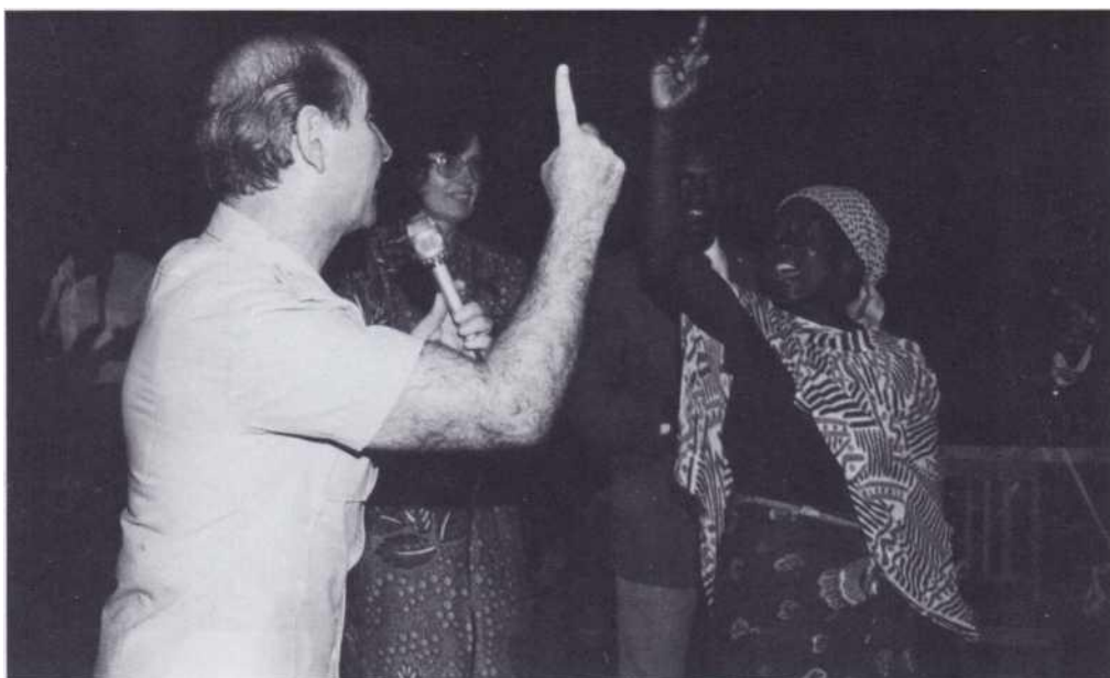
Une autre femme aveugle est merveilleusement guérie ! Alléluia !