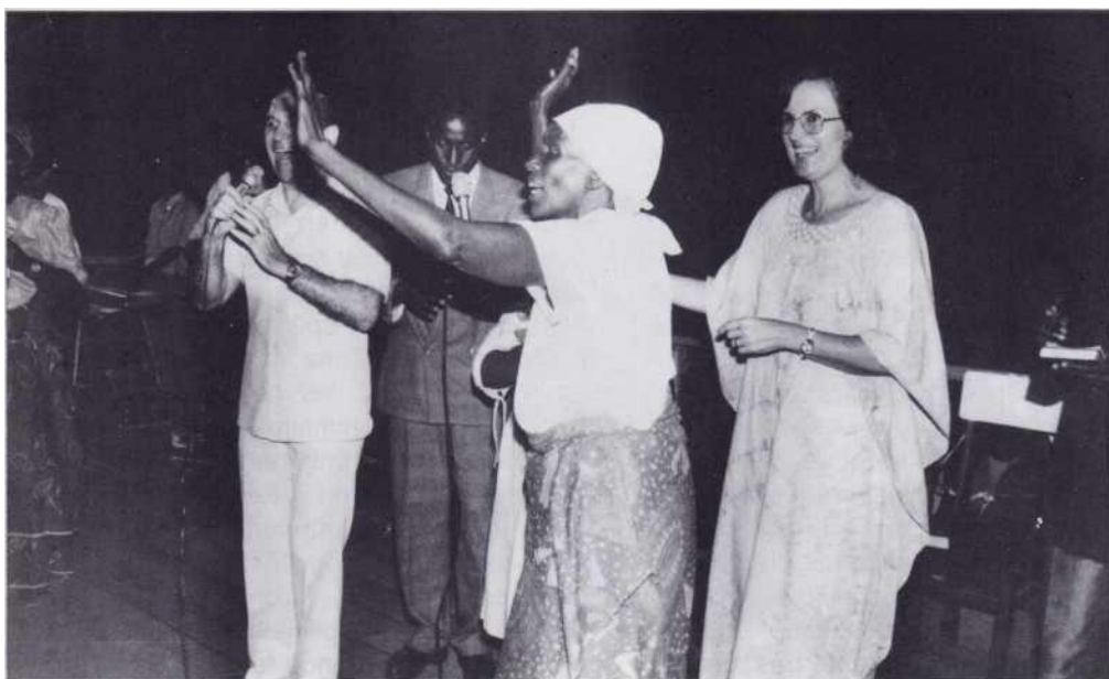
Délivrance d'une femme démoniaque.

grandes campagnes d'évangélisation: la première à Gitega (à 120 km de la capitale, deuxième ville du Burundi) du 11 au 13 janvier, et la deuxième à Bujumbura (capitale du pays) du 15 au 20 janvier 91.