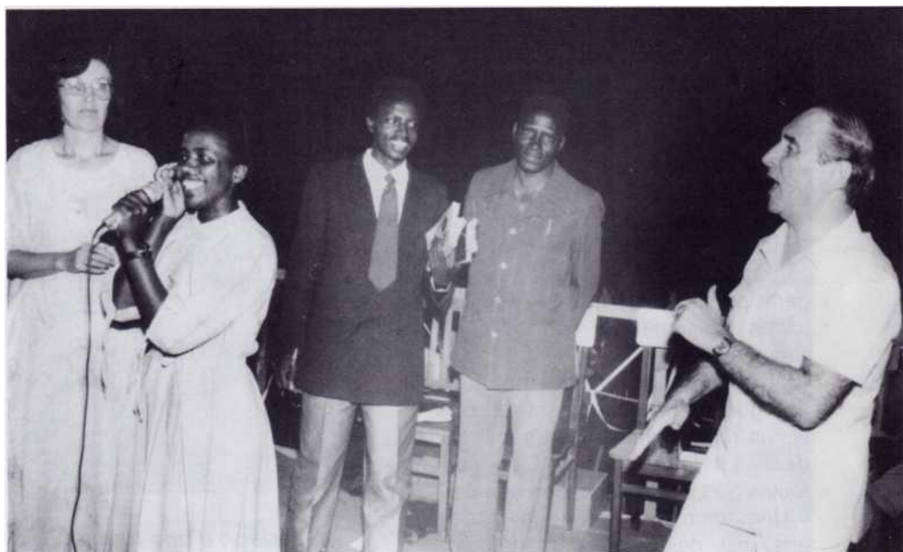
Guérison d'une femme sourde depuis plusieurs années.