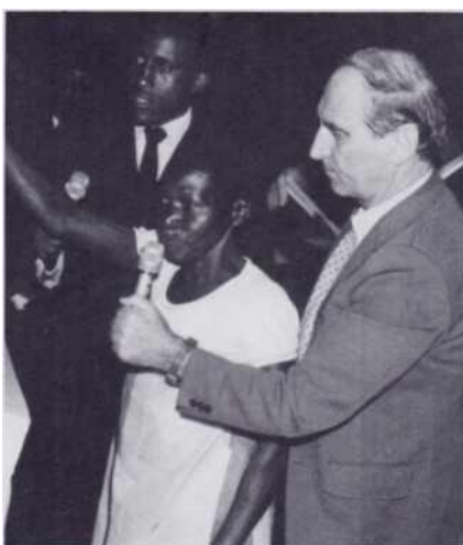
Guérison d'une tumeur derrière l'oreille qui disparaît pendant la prière.