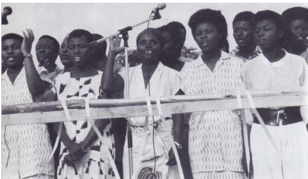
Plusieurs chorales ont glorifié Dieu par leurs chants.