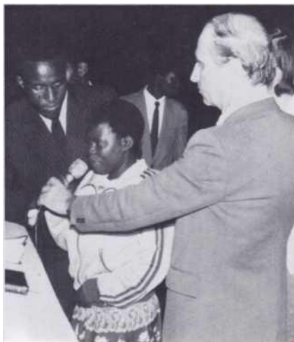
Délivrance d'une folle.