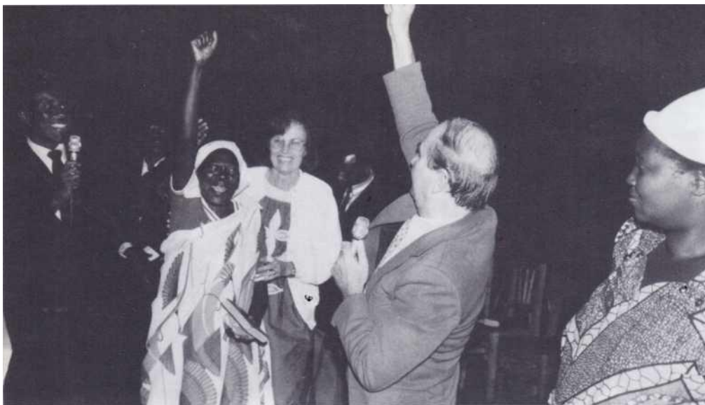
Guérison d'une femme aveugle.