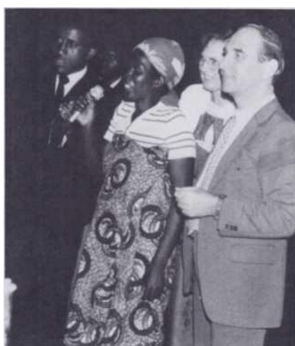
Guérie d'une infection purulente dans la bouche.