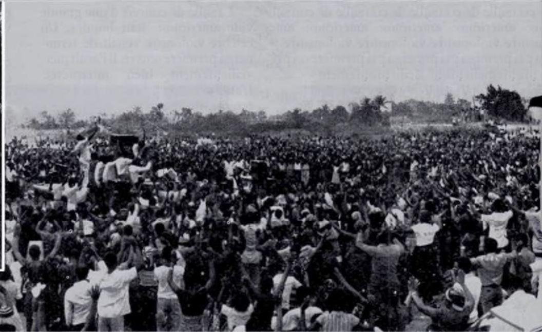
Le dernier jour de la campagne, une foule estimée à environ 20 000 personnes s'est rassemblée au pont Kasa-Vubu à Kinshasa pour écouter la prédication de l'Évangile. Il y eut