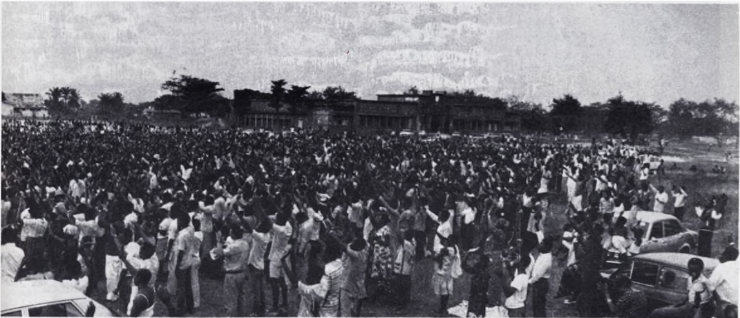
durant la semaine de réunions, des centaines de conversions et de très nombreux miracles. Gloire à Dieu !