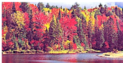
Paysage féérique et multicolore du Québec en automne

« Je publierai les grâces de l'Éternel, les louanges de l'Éternel, d'après tout ce que l'Éternel a fait pour nous ; je dirai sa grande bonté envers nous... » (Es 63 : 7)