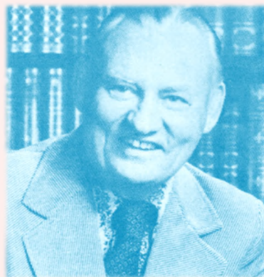
Pasteur Lester Sumral ; extrait de son magazine «World Harvest», (U.S.A)